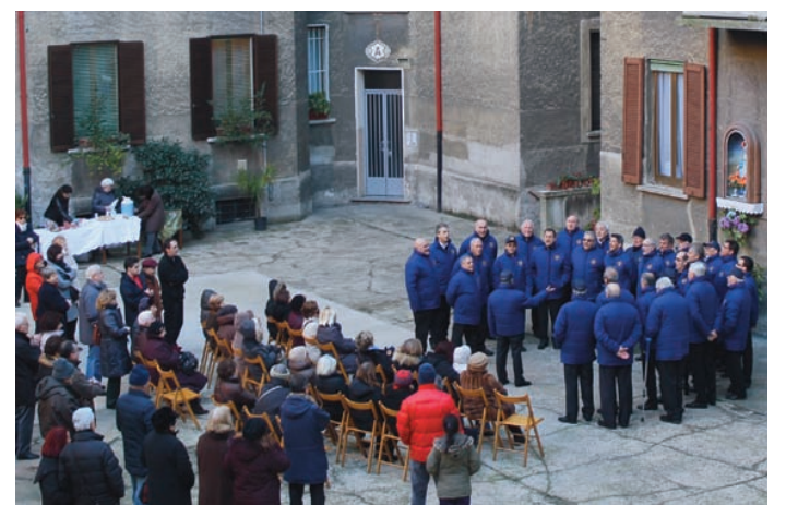
Domenica 24 gennaio 2015 - Cori in nei cortili del Mac Mahon

ribadita anche più recentemente dallo stesso Pereira, di andare a suonare anche in sale teatrali nei quartieri di periferia... cercheremo di arrivare dappertutto. La Scala si deve aprire sempre di più alla città... per fare educazione culturale e anche sociale: è uno dei nostri compiti principali. Allora, chiediamo, qualcuno se ne sta occupando? C'è qualche riunione sindacale