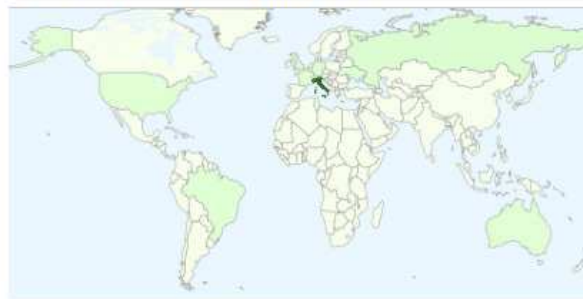
Visualizzazioni di pagine per paese