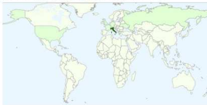
Visualizzazioni di pagine per paese